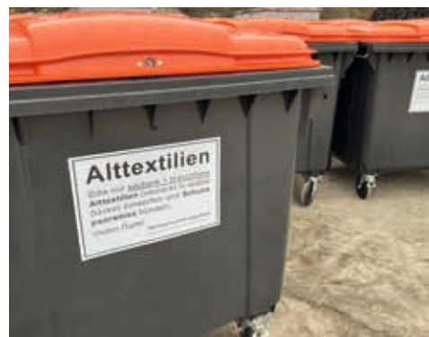
Da die meisten Altkleidercontainer der Wohlfahrtsverbände abgezogen werden, stehen nun auf allen Wertstoffhöfen im Lahn-Dill-Kreis Sammelbehälter für Alttextilien bereit.

Die Altkleiderläden im Lahn-Dill-Kreis werden auch weiterhin saubere und gut erhaltene Alttextilien annehmen. Auch wollen die DRK-Kreisverbände Wetzlar und Dillenburg an ihren Hauptsitzen einige Container stehen lassen.