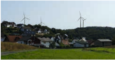
Aus Sicht des Ortsteiles Frechenhausen, oberhalb Beuerbachstraße - Visualisierung

Wasser, Wind, Sonne – sich an Projekten erneuerbarer Energien in der Region zu beteiligen, das hat sich die Energiegenossenschaft Lahn-Dill Bergland bei ihrer Gründung vor genau zehn Jahren auf die Fahnen geschrieben. Bürger, die Mitglied wurden, hatten die Gelegenheit, sich mit dem Erwerb von Anteilen zu beteiligen. Von Beginn an als Mitglied dabei sind auch die Gemeinden Siegbach und Mittenaar. In der Verwaltung freut man sich über eine